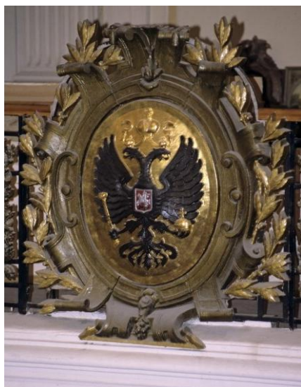
Герб Российской империи в Гербовом зале Главного дома Нижегородской ярмарки.